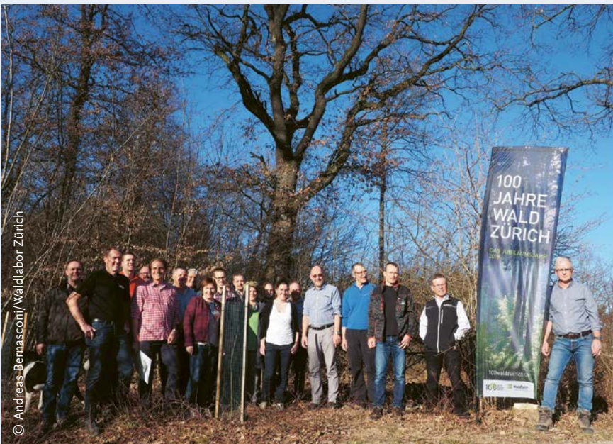
ABBILDUNG 2: Gründung des Trägervereins des Waldlabors Zürich mit der Pflanzung seltener Baumarten.

zeit werden in einem Vorprojekt inhaltliche, technische, organisatorische und finanzielle Fragen geklärt.