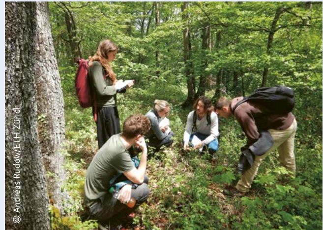
ABBILDUNGEN 3/4: Wichtiges Element der ETH-Lehre im Bereich Wald- und Landschaftsmanagement ist die Arbeit am konkreten Objekt, etwa bei der Beurteilung von Waldstrukturen oder der Arterkennung.

ist ein zweites herausragendes Merkmal des Waldlabors. Dadurch kann situativ die gesamte thematische Palette des bewirtschafteten Waldes beziehungsweise der Wald-Mensch-Beziehung einbezogen werden – auch Themen von morgen. Die Ausrichtung kann dabei disziplinär, interdisziplinär oder transdisziplinär sein. Als Plattform für diese Integration kann das Waldlabor vielfältige Synergien entfalten – auch für das Verständnis und die Lösung komplexer Umweltprobleme.